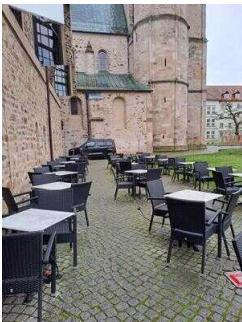
Terrasse am Café