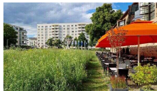
Terrasse am Café