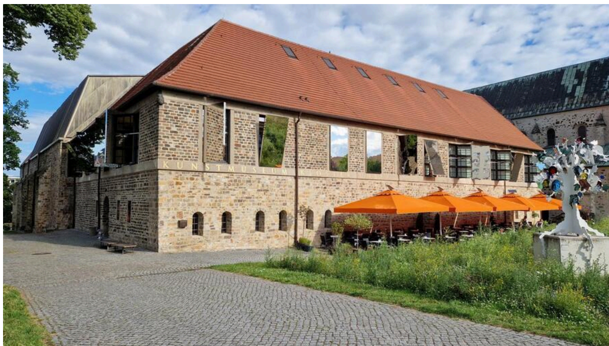
Café Terrasse am Kunstmuseum Kloster Unser Lieben Frauen